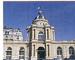
Le palais du Luxembourg (Sénat)