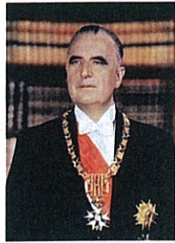
Georges Pompidou 1969-1974