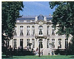
L'Hôtel Matignon (Premier ministre)