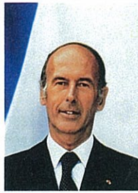
Valéry Giscard d'Estaing 1974-1981