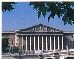
Le Palais Bourbon (Assemblée nationale)