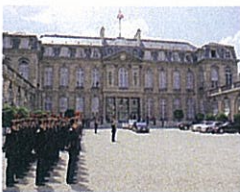
L'Élysée (présidence de la République)