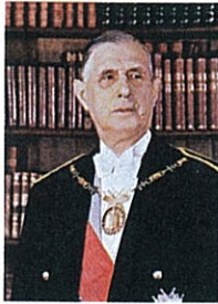
Charles de Gaulle 1958-1969